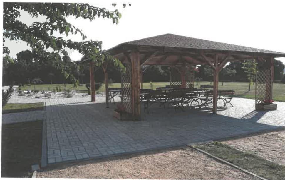
Obrázek č. 4 Objekt Barvířská 495, Most – altán na zahradě

Prostory pro uživatele byly vybaveny sprchovým lůžkem pro imobilní uživatele a polohovacími pečovatelskými lůžky.