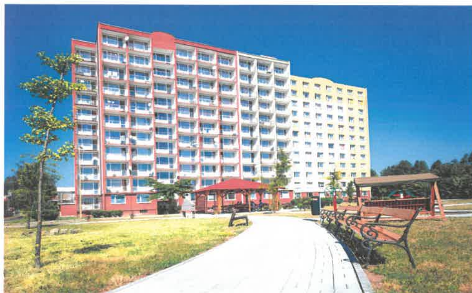
Obrázek č. 3 Objekt Barvířská 495, Most – společenský sál a jídelna