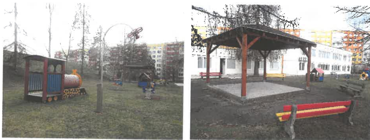
Obrázek č. 13 Objekt Františka Malíka 973, Most

V rámci rehabilitace jsou dětem ve stacionáři poskytovány činnosti zaměřené na rozvoj: