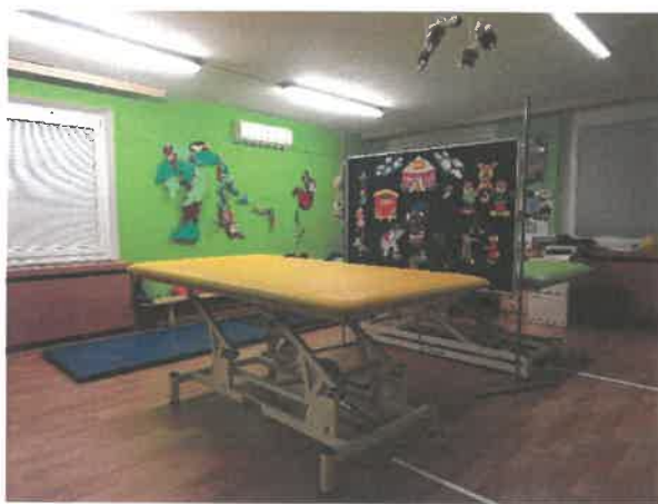
Obrázek č. 14 Objekt Františka Malíka 973, Most – prostory rehabilitace

Aktivizace se neomezuje jen na spolupráci při rehabilitaci, současně je nutné podporovat neuropsychický vývoj dítěte, včetně psychologického a výchovného vedení i sociální adaptace.