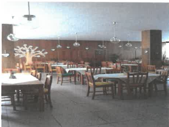
Obrázek č. 17 Objekt Albrechtická 1074, Most – společné prostory