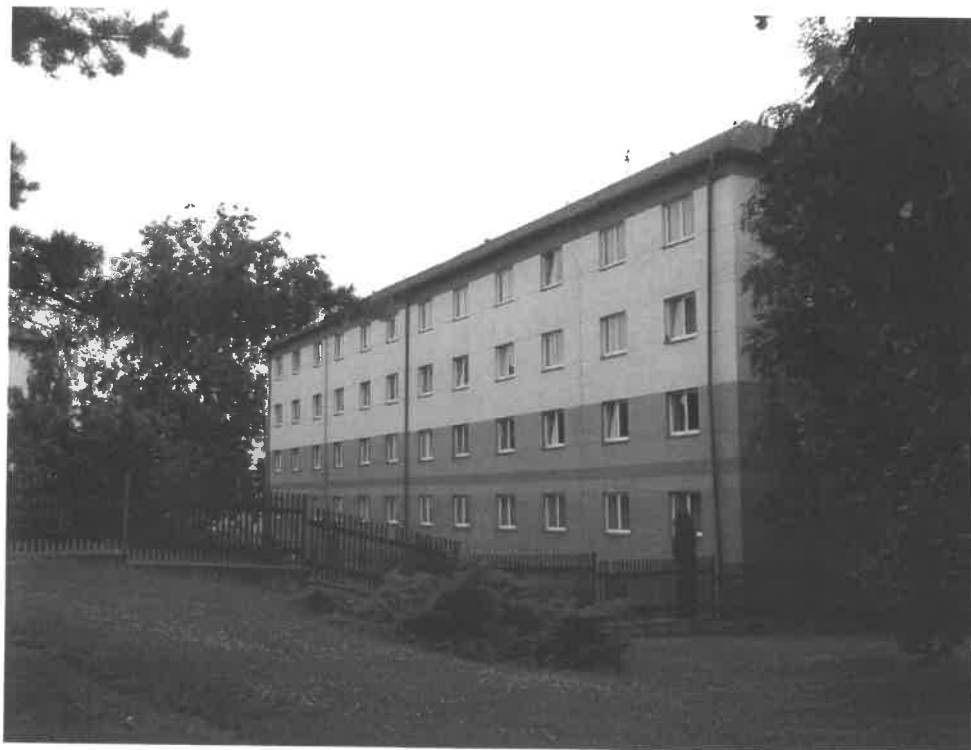
Obrázek č. 8 Objekt Antonína Dvořáka 2166, Most