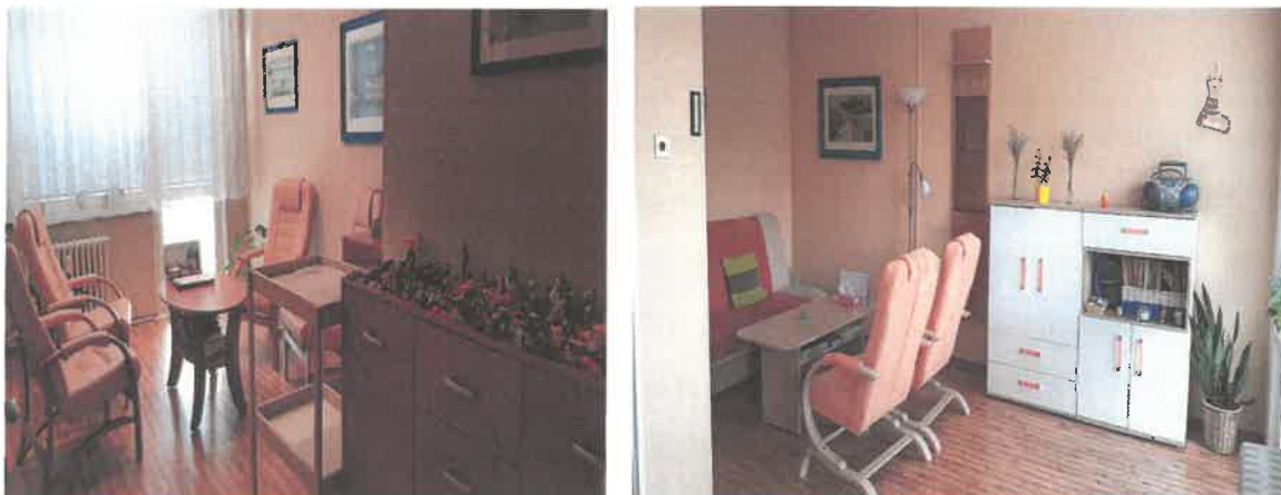
Obrázek č. 20 Konzultační místnosti poradny pro rodinu, manželství a mezilidské vztahy