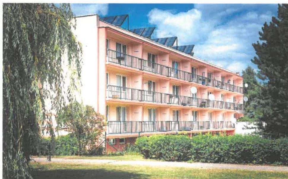
Obrázek č. 5 Objekt Jiřího Wolkerova 404, Most

Kapacita služby je 97 lůžek. Služba je poskytována nepřetržitě. Ubytování je poskytováno ve dvou třípodlažních budovách umístěných v prostředí, které uživatelům umožňuje sociální kontakt s okolním prostředím. Uživatelé mají k dispozici 25 jednolůžkových pokojů s vlastním sociálním zařízením (tzv. garsonky) a 36 bytů typu 1 + 1 (dva samostatné jednolůžkové pokoje se společným sociálním zařízením), které jsou vybaveny vlastním nábytkem uživatele. Společné prostory jsou k dispozici všem uživatelům i špatně mobilním či pohyblivým se na vozíku. Pohyb mezi patry a ven je umožněn bezbariérovým výtahem. Uživatelé mohou využívat klubovnu s televizí, chodby, ergoterapeutickou dílnu, společnou jídelnu a zahradu. Chodby na jednotlivých patrech jsou vybaveny plastovými madly usnadňujícími pohyb a nejsou na nich zbytečné překážky. Uživatelům umožňují posezení křesla umístěná na společných chodbách a knihovničky pro výběr knih. Výzdoba společných prostor je z části dílem některých uživatelů. Ti mohou své tvůrčí schopnosti projevit v ergoterapeutické dílně při aktivizačních činnostech pod vedením ergoterapeutky. Uživatelé