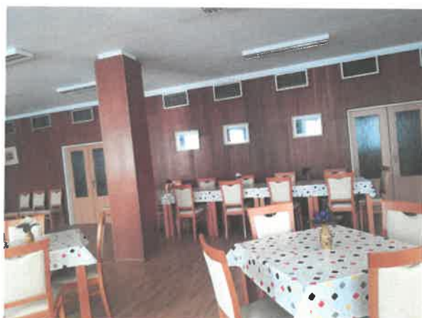
Obrázek č. 18 Objekt Komořanská 818, Most – společné prostory

V roce 2020 byla provedena výměna 27 ks nejvíce poškozených kuchyňských linek, byly vyměněny vstupní dveře do bytů v celé části budovy B a 4 ks v budově A. Dveře byly také vyměněny v kanceláři vedoucí, ve služební místnosti a 7 ks bylo vyměněno v prostorách pečovatelské služby. Bylo vyměněno lino v nouzových východech a v suterénu. V nouzových východech byla také provedena výmalba.