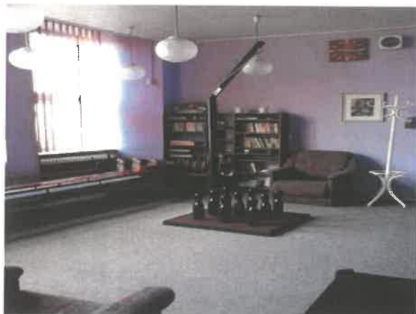
Obrázek č. 19 Objekt Ke Koupališti 1180, Most – společné prostory

V roce 2020 byla provedena výměna jističů ve všech bytových jednotkách, malování chodeb celého zařízení, výměna rozhlasu, který je na služebně zařízení. Byly vyměněny boční vstupní dveře v objektu a byla provedena výměna osvětlení ve vstupní hale a přízemí.