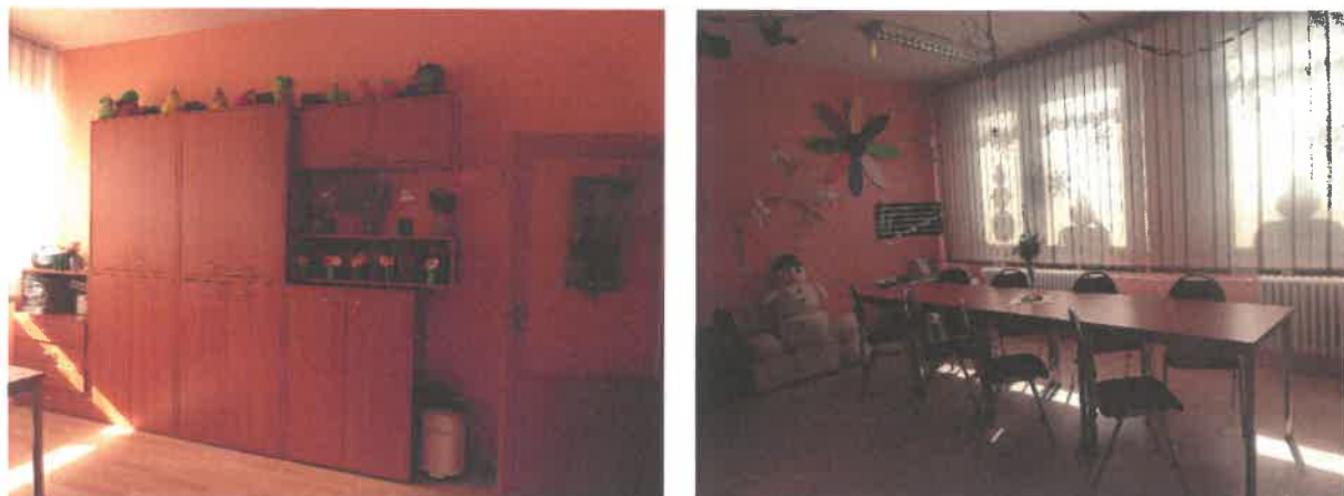
Obrázek č. 11 Objekt Jiřího Wolkerova 404, Most – prostory stacionáře

Služba byla v roce 2020 poskytnuta 15 klientům. Pro uživatele byla zorganizována spousta aktivit, které vedly k integraci osob s mentálním postižením do společnosti.