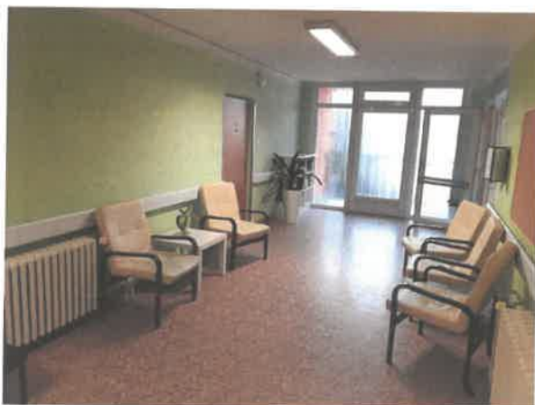
Obrázek č. 7 Objekt Jiřího Wolkerova 404, Most – společné prostory

V roce 2020 byla dokončena výměna plotu kolem objektu, dále proběhla rekonstrukce tří bytových jader v bytových jednotkách. Byla provedena rekonstrukce sociálního zařízení v přízemí budovy a společenské místnosti. V rámci menších úprav v bytových jednotkách byla provedena u 10-ti bytových jednotek výměna podlahové krytiny a kuchyňských linek. Do zařízení byly zakoupeny 3 ks aktivních antidekubitních matrací, 1 toaletní křeslo a 5 ks elektrických polohovacích lůžek včetně příslušenství.