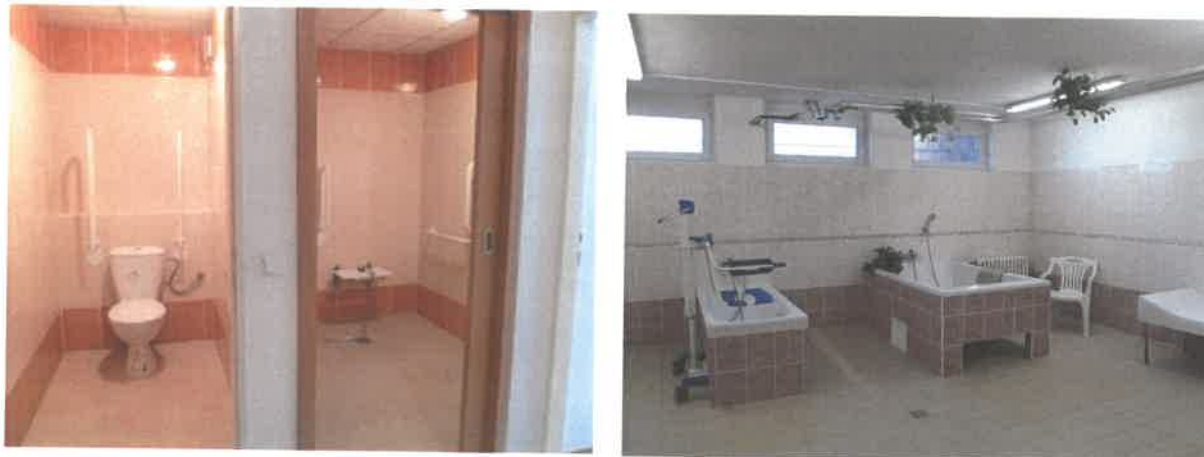
Obrázek č. 6 Objekt Jiřího Wolkerova 404, Most – zrekonstruovaná sociální zařízení a centrální koupelna

V roce 2020 byla dokončena výměna plotu kolem objektu, dále proběhla rekonstrukce tří bytových jader v bytových jednotkách. Byla provedena rekonstrukce sociálního zařízení v přízemí budovy a společenské místnosti. V rámci menších úprav v bytových jednotkách byla provedena u 10-ti bytových jednotek výměna podlahové krytiny a kuchyňských linek. Do zařízení byly zakoupeny 3 ks aktivních antidekubitních matrací, 1 toaletní křeslo a 5 ks elektrických polohovacích lůžek včetně příslušenství.