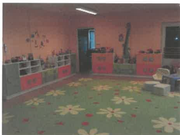
Obrázek č. 16 Středisko denní péče – prostory herny

Posláním střediska je poskytování výchovné a zdravotně preventivní péče dětem ve věku od 16 měsíců do 3 let věku. Kapacita střediska je 23 míst. Středisko bylo v průběhu roku 2020 v provozu 196 dní, v průměru docházelo denně 12 dětí. K 31. prosinci 2020 bylo zapsáno k denní docházce 18 dětí. V roce 2020 proběhla výměna vzduchotechniky a krytin v kuchyni, zakoupilo se také nové nádobí a elektrospotřebiče do kuchyně. Do altánu na zahradě byl pořízen dřevěný nábytek a zároveň zde byly dokončeny zábrany a nájezd. V neposlední řadě došlo také k nákupu nových hraček pro děti. Chod zařízení byl v roce 2020 ovlivněn pandemií COVID-19, kdy bylo na jaře dva měsíce uzavřené, a veškeré následné aktivity se realizovaly v závislosti na dodržování epidemiologických opatření. Zařízení se zúčastnilo ankety Osobnost Ústeckého kraje za rok 2019.