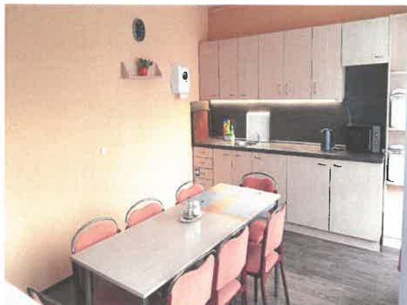
Obrázek č. 15 Pečovatelská služba – zázemí pro pracovníky pečovatelské služby a vozidlo pro rozvoz stravy