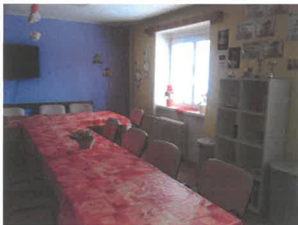
Obrázek č. 9 Objekt Antonína Dvořáka 2166, Most – společné prostory zařízení

V roce 2020 byla zrealizována další etapa rekonstrukce sociálního zařízení ve čtyřech bytových jednotkách. Zároveň v roce 2020 proběhla celková rekonstrukce výtahu. Díky sponzorským darům od velkých společností byly na zařízení zakoupeny tři velké sady zahradního nábytku.