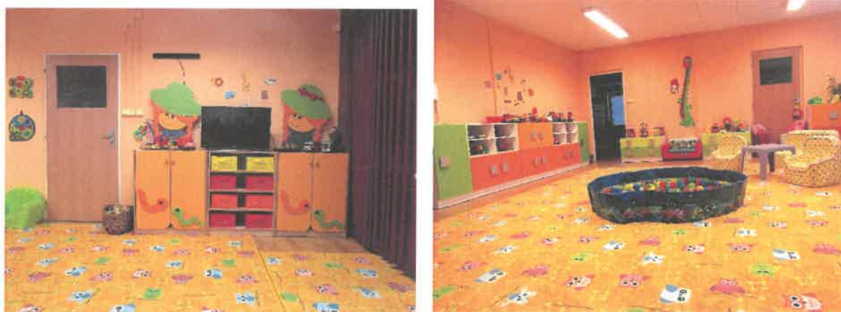
Obrázek č. 12 Objekt Františka Malíka 973, Most – prostory stacionáře

V roce 2020 došlo k vybavení altánu na zahradě stacionáře novým dřevěným nábytkem, také zde byly dokončeny zábrany a nájezd. Ke zvýšení komfortu poskytované sociální služby přispěla rovněž obnova stávajícího majetku, a to například stolku a židliček do herny pro děti. Dále byly pořízeny různé hračky, didaktické pomůcky, bezdotykové teploměry, balanční bednička pro fyzioterapii. V kuchyni byla vyměněna vzduchotechnika a krytina, nakoupilo