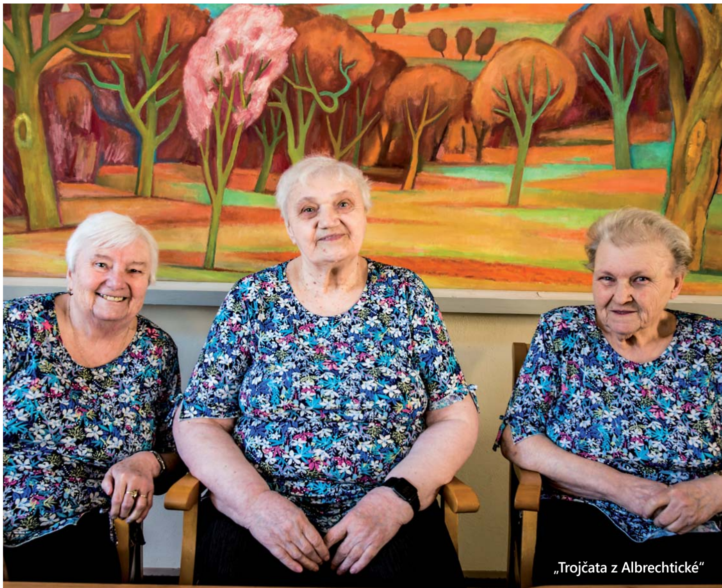
„Trojčata z Albrechtické“